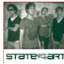
Design + Foto: Büro für Gestaltung, Herrenberg